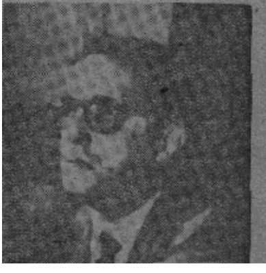
巴西瓜那巴拉州长拉瑟达