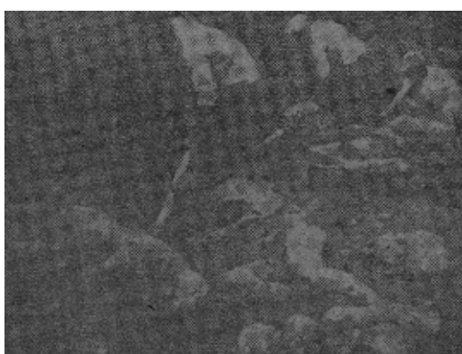
左图为意大利庞培城发掘情形

经专家考察后，认为这八个人是分属两个家庭，更能分出其中三个是男人，两个是女人，三个是小孩。